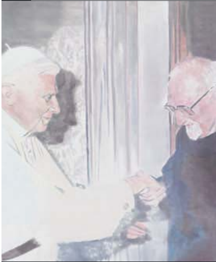
ZENO X GALLERY/GF